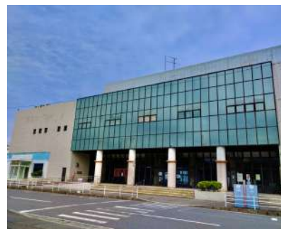
別府国際観光港 旧フェリーさんふらわあ乗り場

瀬戸内海の西に位置する穏やかな別府湾と、鶴見岳や扇山などの美しい山並を眺めることができる港の旧ターミナルビルです。かつては定期フェリーや観光船が寄港する別府の玄関口として賑わいましたが、2022年にその機能を隣接する新ターミナルビルへと移しました。長きにわたり、日々、数多くの旅人を迎え入れては送り出してきた旧フェリーさんふらわあ乗り場は、フリーマーケットや骨董市、音楽祭などの会場として、今もさまざまに活用されています。