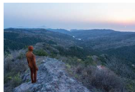
「ANOTHER TIME XX」 2013, Antony Gormley Photo: Takashi Kubo (C) KUNISAKI ART FESTIVAL Committee