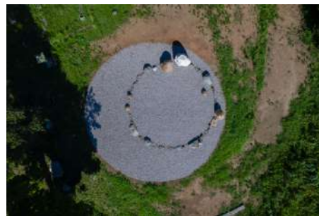
「首飾り ― 石を持って山に登る」 2021, 島袋道浩